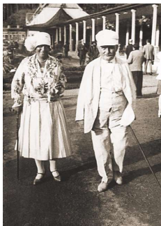
L. Janáček v Luhačovicích.